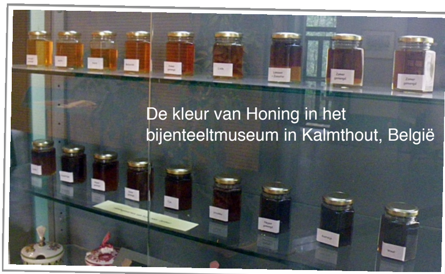
De kleur van Honing in het bijenteeltmuseum in Kalmthout, België