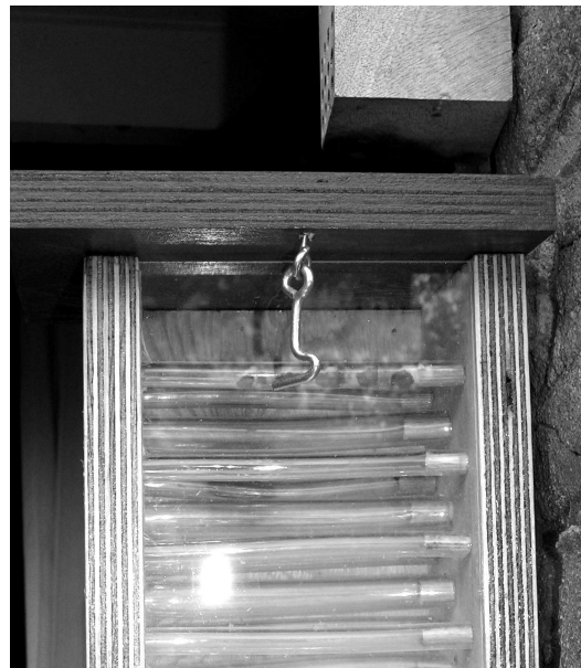
Wilde bijenhotel na drie dagen al in gebruik genomen Te verkrijgen via het depot