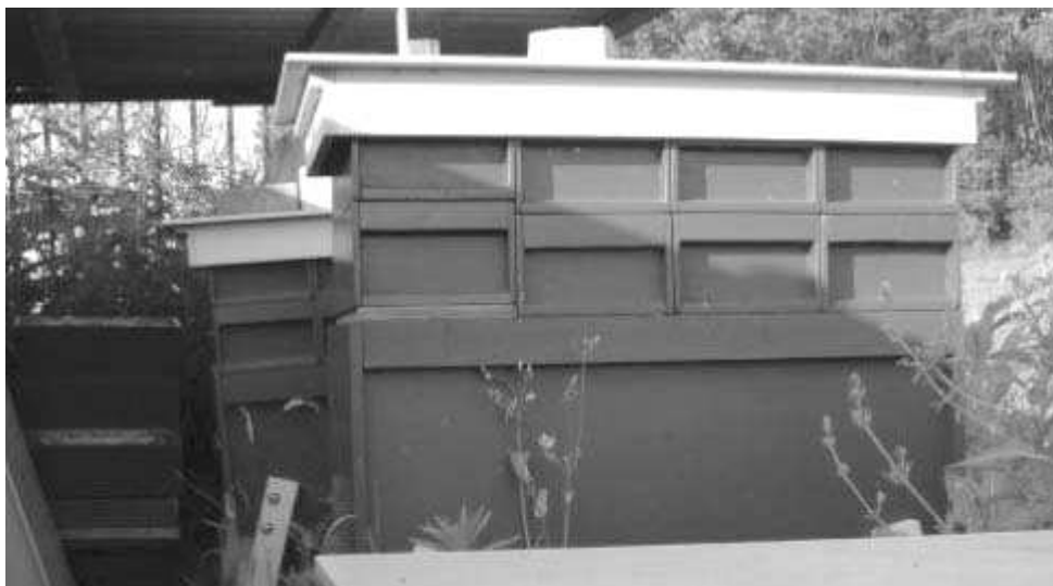
“Darlington Hive” van Johan Beckers